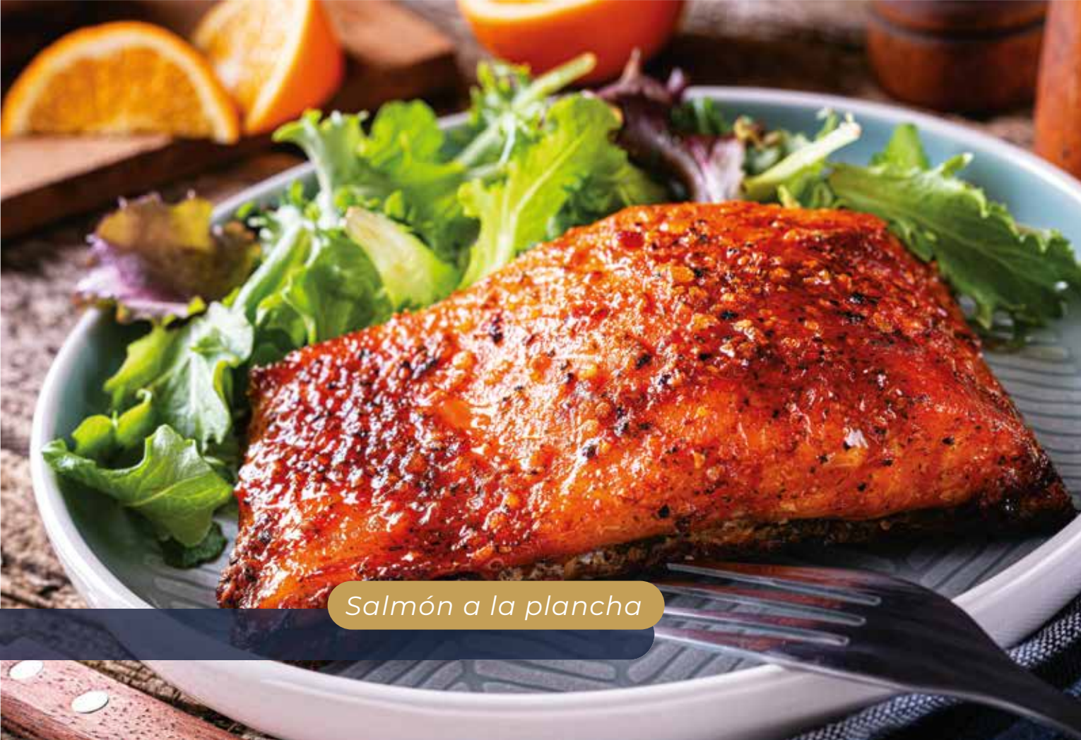
Salmón a la plancha