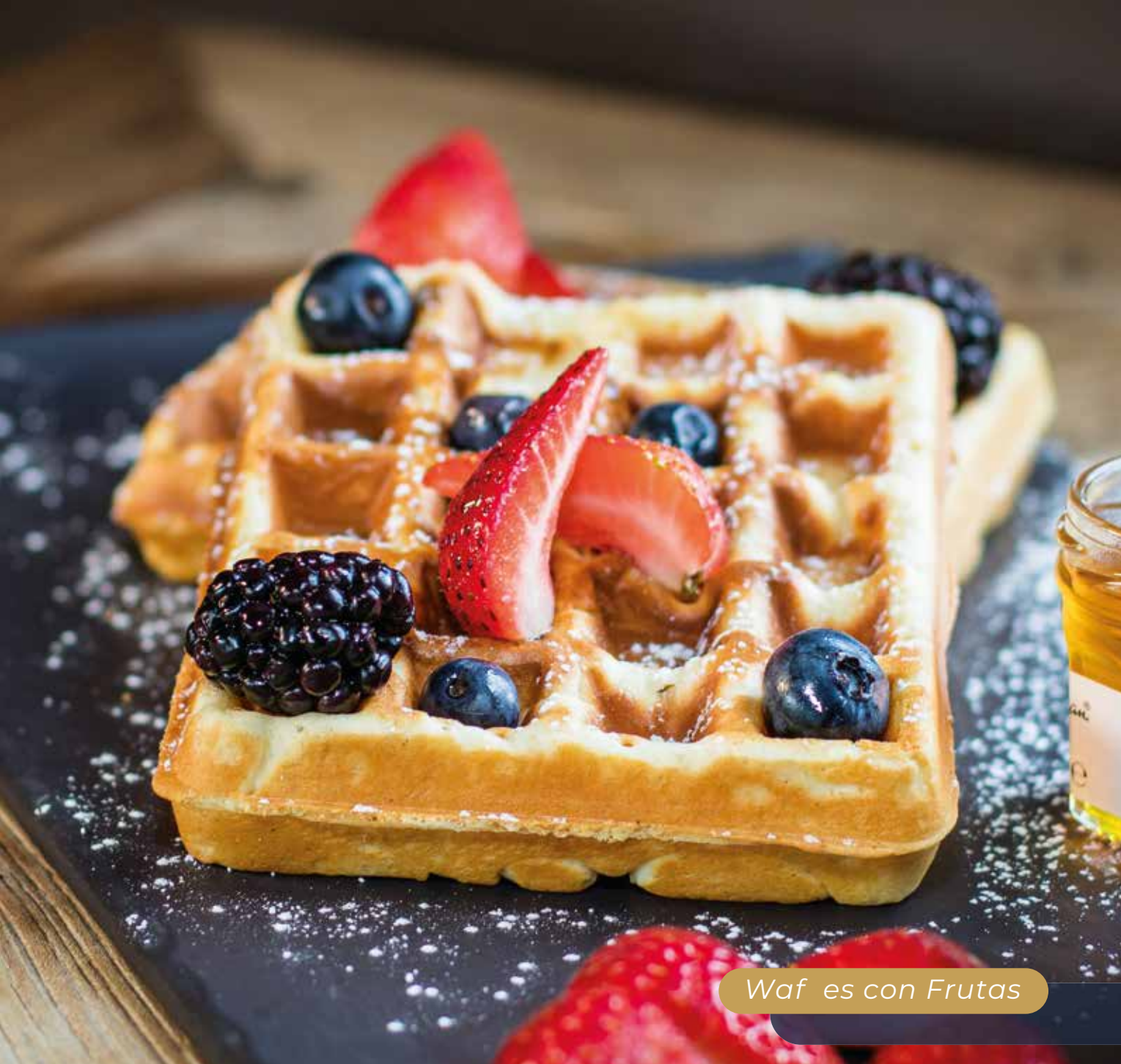
Wafles con Frutas