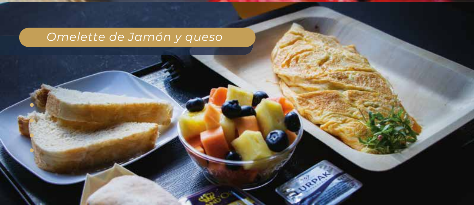
Omelette de Jamón y queso