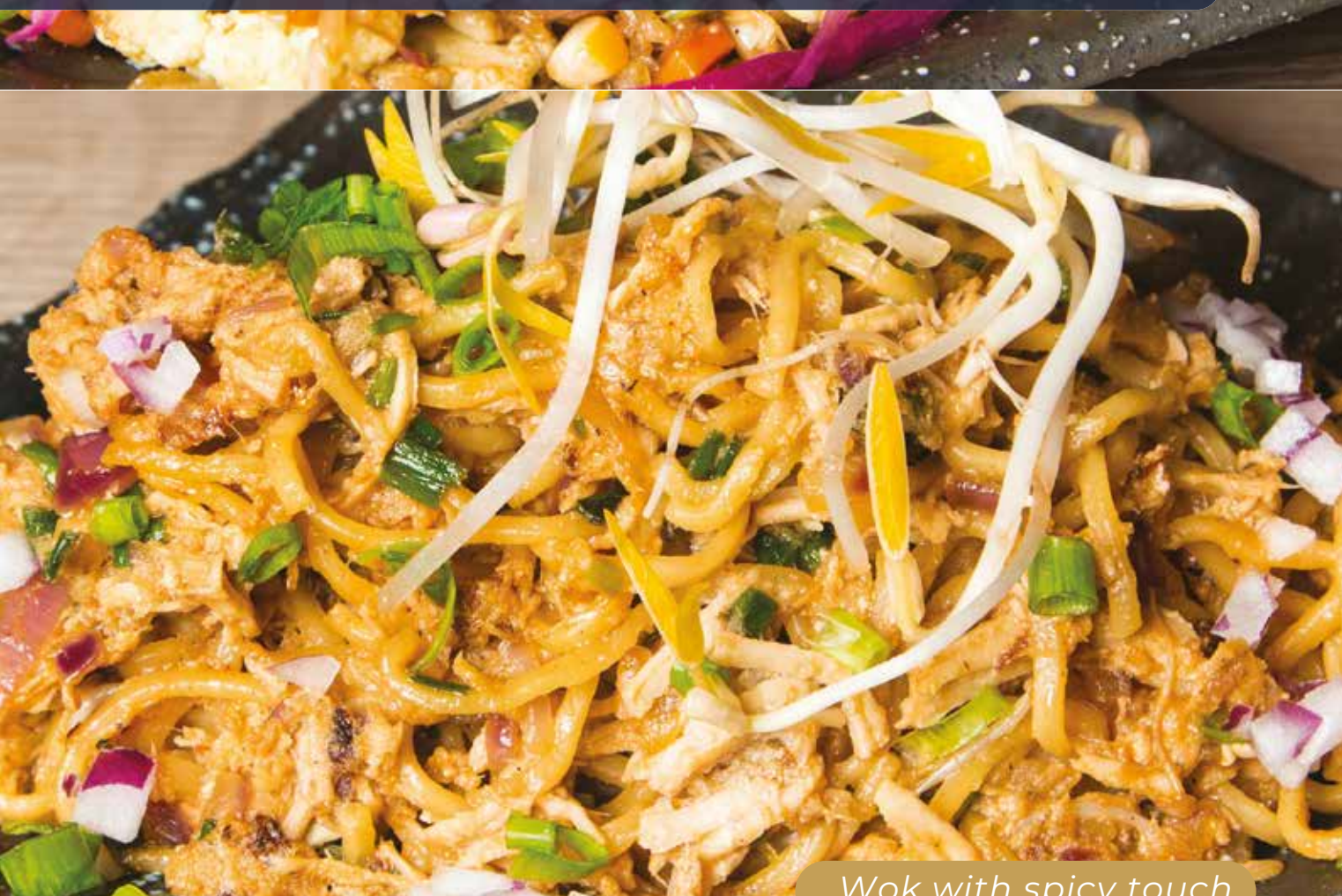
Wok with spicy touch