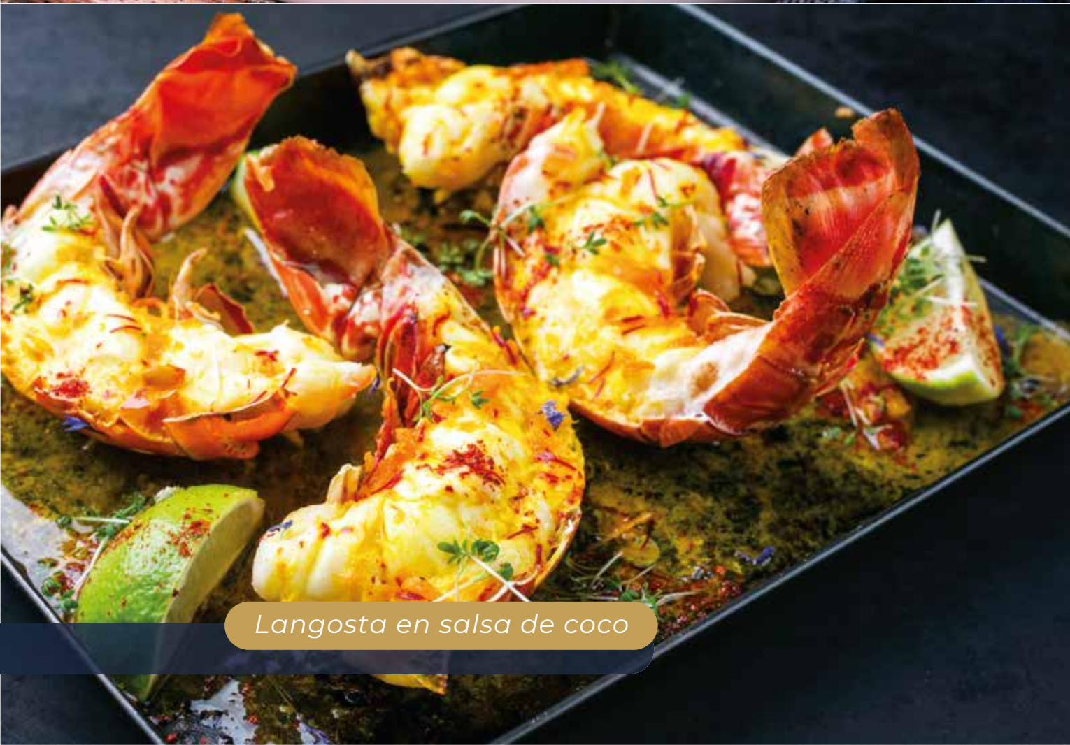
Langosta en salsa de coco