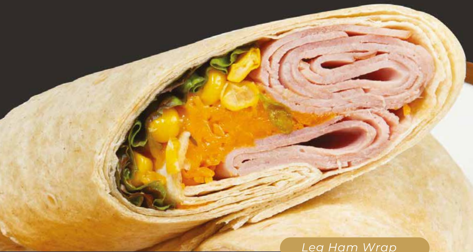
Leg Ham Wrap